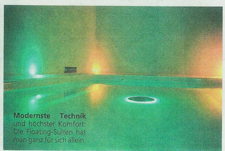
Modernste Technik und höchster Komfort: Die Floating-Suiten hat man ganz für sich allein.